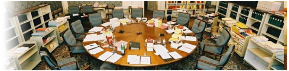
Die Entscheidung des Verfassungsgerichtshofes wird noch für Frühjahr erwartet.

Der VfGH hat noch vor dem Jahreswechsel das Gesetzesprüfungsverfahren betreffend die Bewertung von Grundstücken bei der Erbschafts- und Schenkungssteuer mit dem dreifachen Einheitswert ausgeweitet. Nach nunmehriger Ansicht des VfGH dürfte die ganze Erbschaftssteuer verfassungswidrig sein. Der VfGH hat im Zuge seiner weiteren Beratungen erkannt, dass das eigentliche verfassungsrechtliche Problem bei der Erbschafts- und Schenkungssteuer darin besteht, dass Kapitalanlagen (insbesondere Bankguthaben, Sparbücher und Anleihen) infolge der Endbesteuerung ohne ausreichende sachliche Begründung zur Gänze von der Erbschaftssteuer befreit sind (nicht aber von der Schenkungssteuer!). Da diese Befreiung aber in einem Verfassungsgesetz geregelt ist, ist sie für den VfGH nicht angreifbar. Die Steuergerechtigkeit kann nach den vorläufigen Überlegungen des Höchstgerichts daher offensichtlich nur dadurch hergestellt werden, dass die ganze Erbschaftssteuer aufgehoben wird. Im Falle einer Aufhebung der Erbschaftssteuer durch den VfGH hat